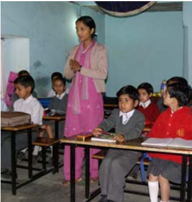
Unterricht in einer Schule