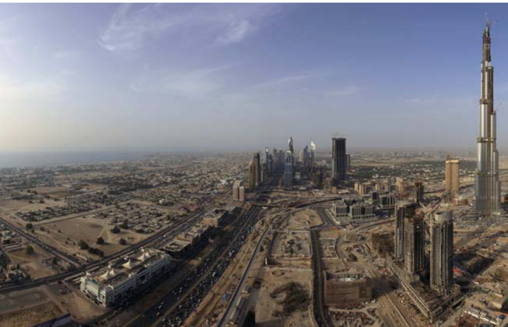
Imposanter Rundumblick über die Skyline von Dubai mit Burj Dubai im Mittelpunkt

Mittelmaß ist in Dubai nicht gefragt. Schon gar nicht, wenn es ums Bauen geht. Nach dem Motto „höher, schneller, weiter“ werden hier Bauten aus dem Boden gestampft, die allen Superlativen gerecht werden – sowohl was Flächen, Gebäudegrößen und -höhen als auch Projektvolumen, Architektur, Bauzeit, Vermarktung und Nutzung angeht. Unglaublich erscheint es, in welchen Dimensionen sich das Bauen hier abspielt.