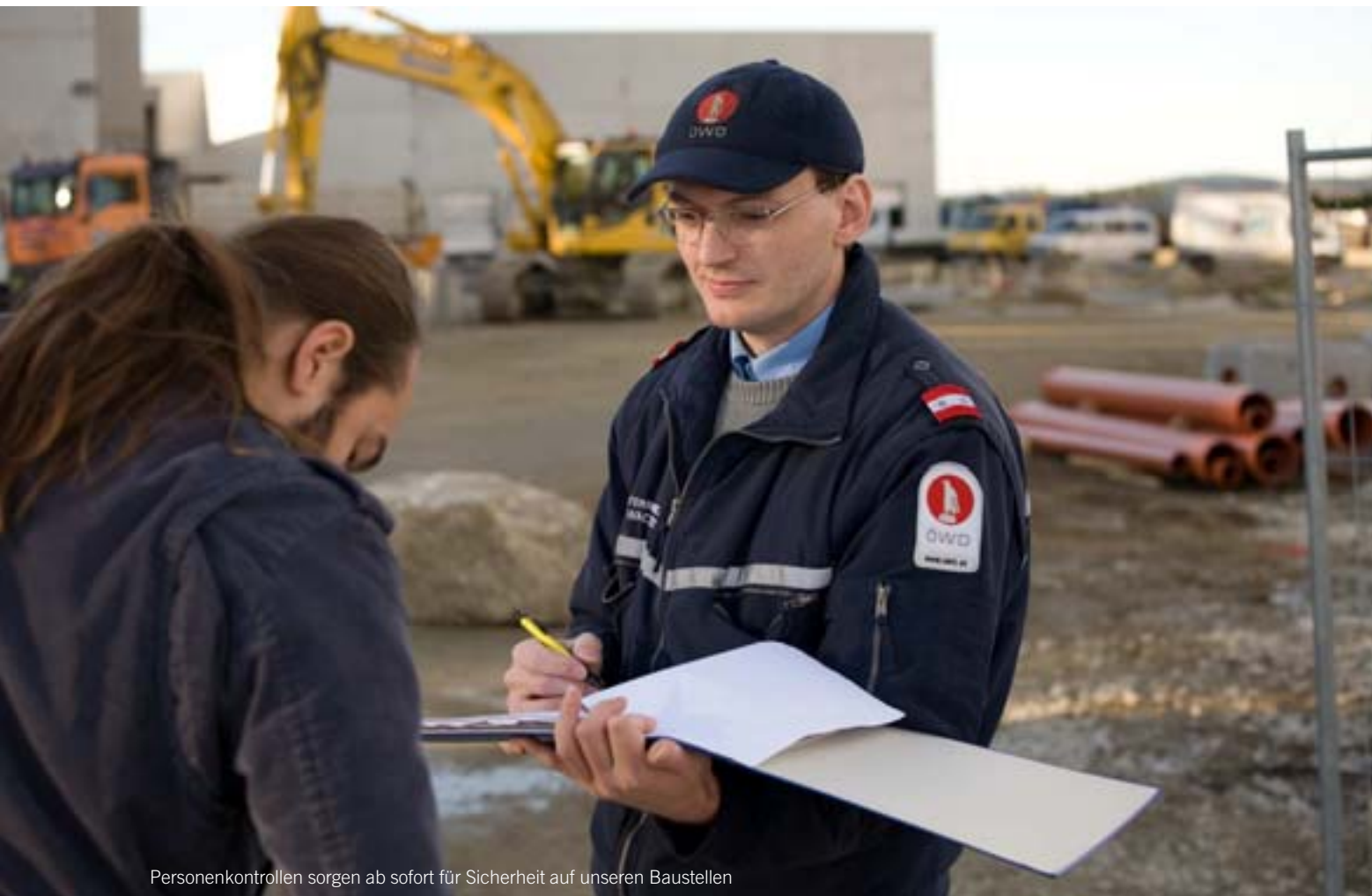
Personenkontrollen sorgen ab sofort für Sicherheit auf unseren Baustellen

Österreichischer Wachdienst sorgt für Sicherheit