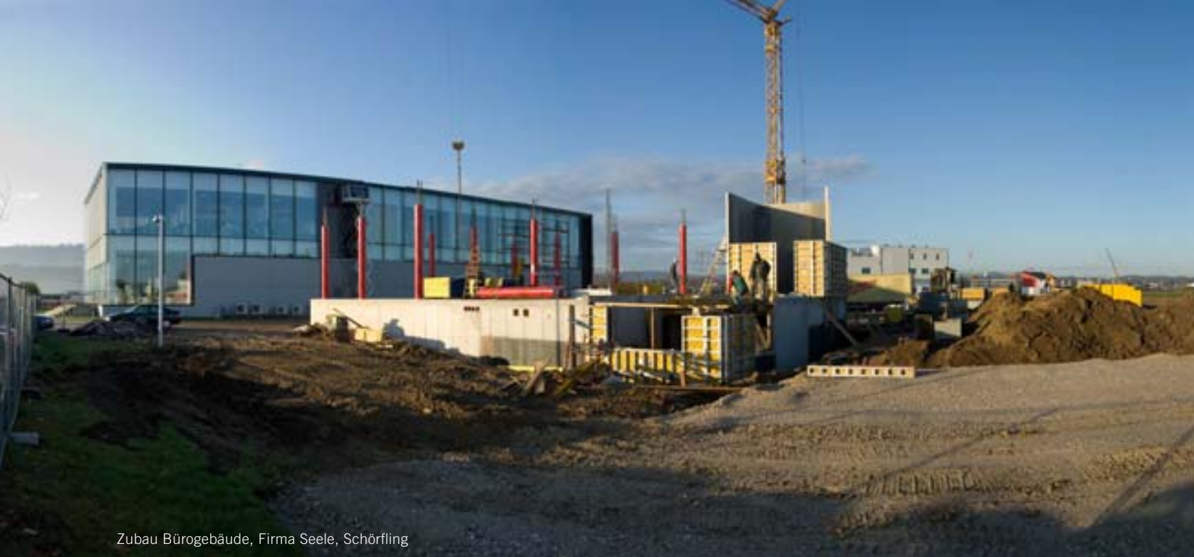
Zubau Bürogebäude, Firma Seele, Schörfling