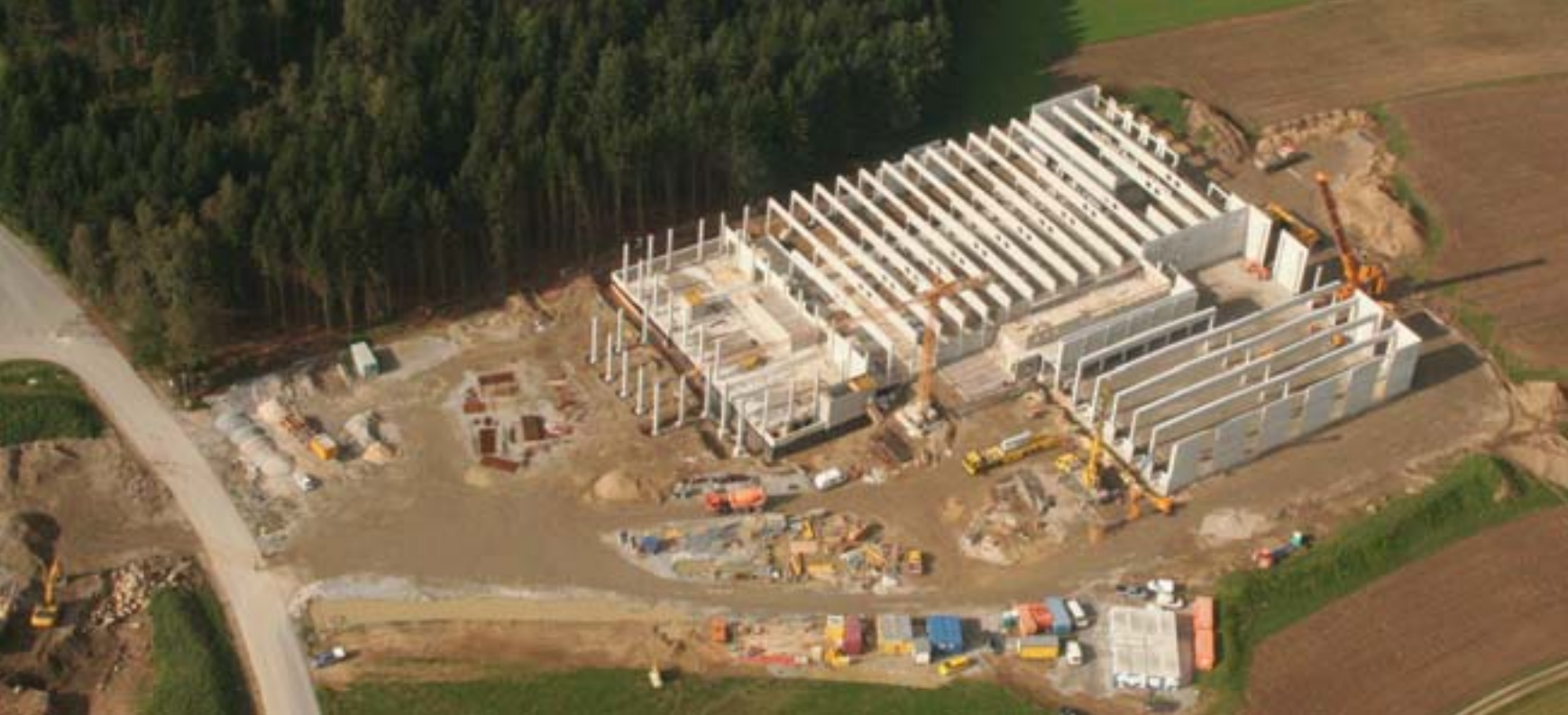
Neuer Betriebsstandort im Mühlviertel