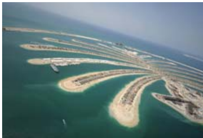
Künstlich im Meer aufgeschüttete Insel "The Palm Jumeirah"

Spekulationen. Auf der Website www.burjdubai.com wird die aktuelle Höhe im Herbst 2008 mit 688 Metern beziffert. Auszugehen ist davon, dass der fertige Turm weit über 700 Meter hoch sein und mehr als 150 Stockwerke besitzen wird. Die Projektgesellschaft Emaar Properties bezeichnet ihn als Symbol des „neuen Nahen Ostens“: wohlhabend, dynamisch und erfolgreich. Nach dem Vorbild einer Wüstenblume gestaltete Architekt Adrian Smith die Gebäudebasis „dreiblättrig“ in Form eines Ypsilon. Nach oben hin verjüngt sich der Turm spiralförmig zu einer immer schmaler werdenden Spitze. Der Burj Dubai ist Mittelpunkt des Stadtentwicklungsprojektes Downtown Dubai. In seinen unteren 37 Etagen wird ein Hotel untergebracht, darüber Büros und Suiten. Die 124. Etage ist als Aussichtsplattform mit Außenterrasse geplant. Jedes 20. Stockwerk ist für die Gebäudelogistik (insbesondere für Systeme zur Gebäudekühlung) vorgesehen. Die Projektkosten wurden mit ca. 1,8 Milliarden US-Dollar beziffert. Die Finanzierung erfolgt durch die königliche Maktoum-Familie.