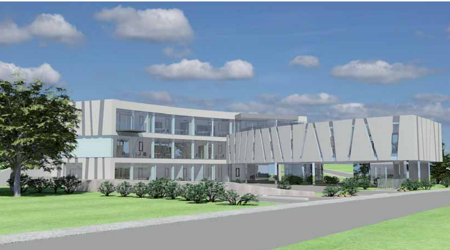
Das neue T.T.I.-Gebäude wird als erstes Projekt errichtet